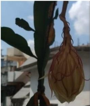
15 Sep 2020

10. బ్రహ్మ కమలం మొక్క పునరుజ్జీవింప చేయడం 11615...ఇండియా మొక్కల ప్రేమికురాలైన ప్రాక్టిషనర్ యొక్క పెద్ద కోడలు 5