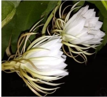
10 July 2021