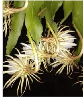
5 Sep 2021

సంవత్సరాల క్రితం బ్రహ్మకమలం (ససూర్య అబ్వులత) నాటారు. అది చక్కగా పెరుగుతూనే ఉంది కానీ ఒక పుష్పం కూడా వికసించలేదు. ఐతే తన మలబద్ధకం సమస్య కోసం మరియు కోవిడ్-19 మహమ్మారి సమయం లోనూ వైబ్రియానిక్స్ యొక్క