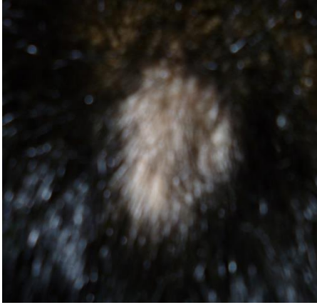
28 మార్చి 2015

చికిత్సను ప్రారంభించాము. దేవుని దయ, దీవెనలతో, 2015 మే నాటికి బట్టతల ప్రదేశం కొత్త జుట్టుతో నిండినది. మేము నా కుమారుని సమస్య బాగుచేసినందుకు భగవాన్ కు, మంచి వైబ్రో ప్రాక్టీషనర్కు మా ధన్యవాదాలు.