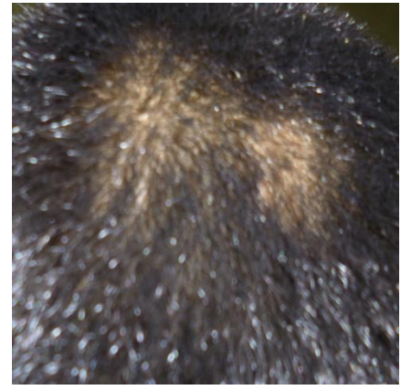
9 మే 2015