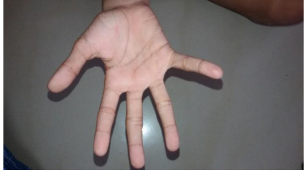
చికిత్స తరువాత (26, అక్టోబర్)