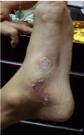
కాలిమడమ చికిత్సకు ముందు (9 ఏప్రిల్ 2015)

బాలుడి తల్లిదండ్రులు చాలా ఆనందంగా ఉన్నారు. వారి కొడుకు పూర్తి పునరుద్ధరణకు స్వామికి కృతజ్ఞతలు తెలుపుకున్నారు. వారు బాలునిపై స్టెరాయిడ్స్ వాడటంవల్ల, ప్రతికూల ప్రభావాలు వచ్చే అవకాశమున్నందున అవి వాడవల్సిన అవసరం కలగనందుకు కూడా సంతోషంగా ఉన్నారు.