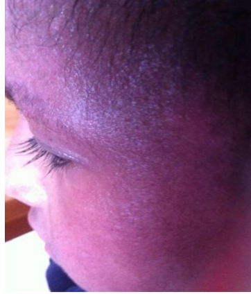
9 మే 15