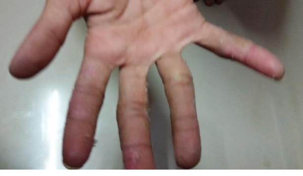
చేయి చికిత్సకు ముందు (9 ఏప్రిల్ 2015)