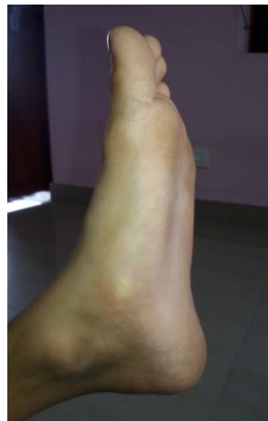
చికిత్స తరువాత (26, అక్టోబర్)