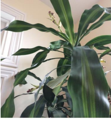
Second view, October 2014