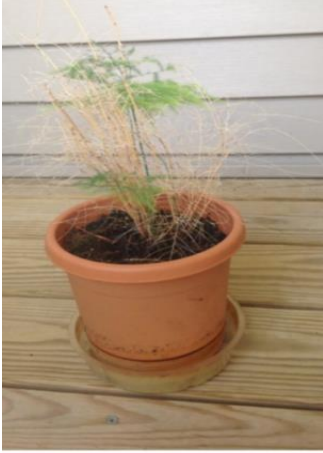
Fern, August 2013

ప్రాక్టిషనర్ వ్రాస్తున్నారు : వైబ్రియోనిక్స్ సమావేశం సంపుటంలోని నా వ్యాసంలో, నేను 2013 ఆగస్ట్ లో మరో ప్రదేశం తరలి వెళ్ళే సమయంలో బాగాపాడైన వివిధరకాల ఇంట్లో పెరిగే మొక్కలు, వైబ్రియోనిక్స్ వాడుకవల్ల ఆరోగ్యంగా పెరిగిన సంగతి తెల్పితిని. నేను వాటికి యిచ్చినవి: #CC1.2 Plant tonic + CC15.1 Mental & Emotional tonic... 3TW నీటిలో కలిపితిని.