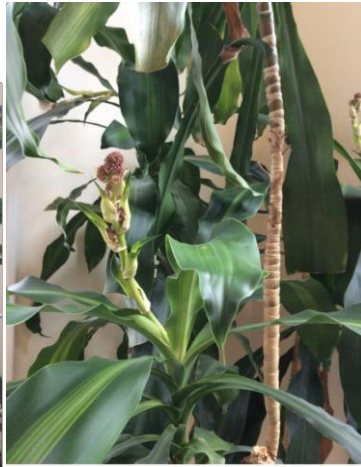
In bloom, October 2014