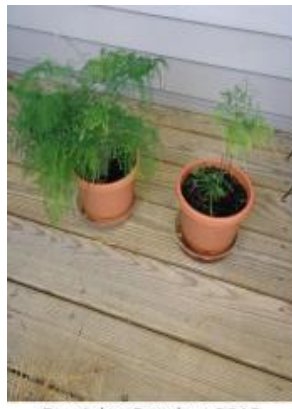
On right, October 2013