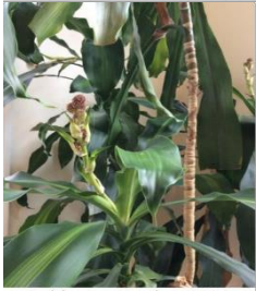
In bloom, October 2014