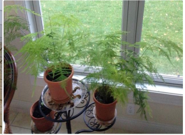
On right, October 2014