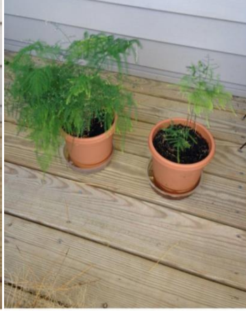
On right, October 2013