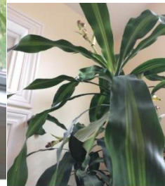
Second view, October 2014