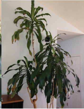
Corn plant, August 2013