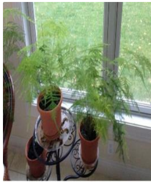
On right, October 2014