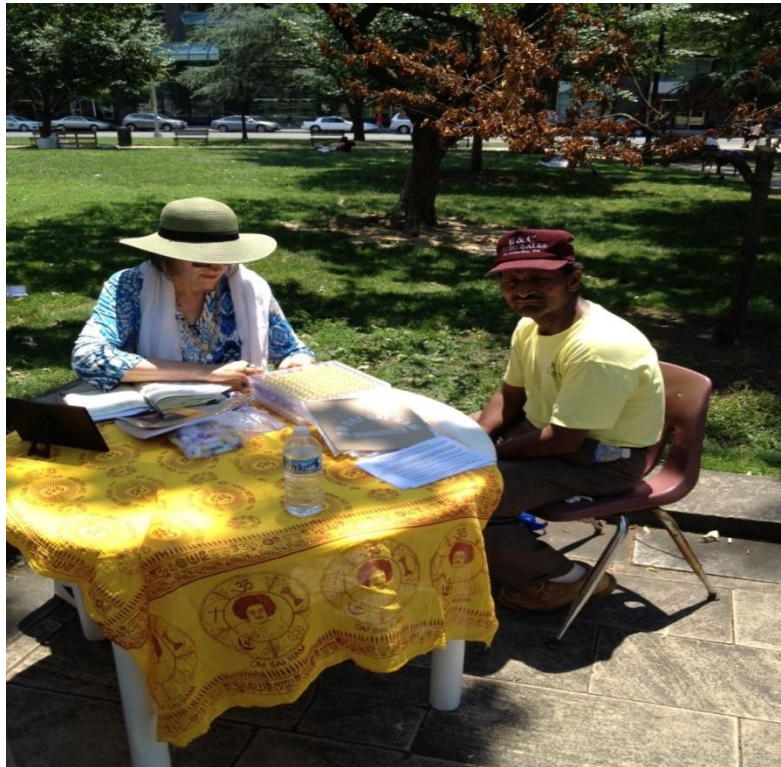
అమెరికా లోని వాషింగ్టన్ DC పార్కు వద్ద గూడులేని నిరుపేదలకు వైట్లో సేవలు