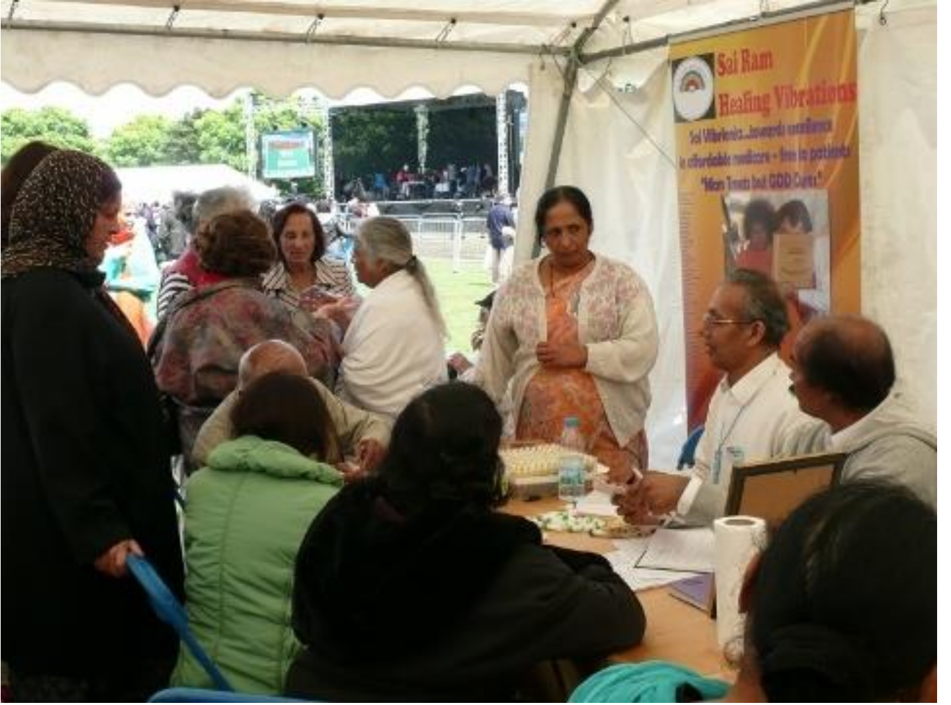
లండన్ లోని సౌతాల్ పార్కులో భిన్న మత విశ్వాసాల ఐక్యతా పర్యదినమున నిర్వహించిన వైట్లో స్టాల్