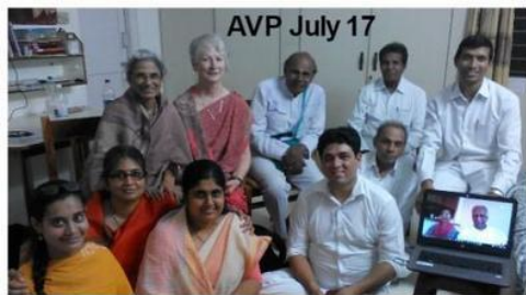
AVP July 17

trainings intensivos de 5 días, todos los AVPs reciben experiencia directa de tratamientos bajo supervisión de al menos 15 pacientes cada uno.