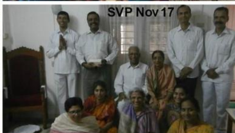
SVP Nov 17

2018, recibieron el entrenamiento avanzado todos ellos.