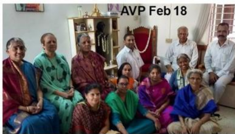
AVP Feb 18

Cada nuevo y calificado AVP es tomado bajo un mentor personal bajo cuyo cuidado se supone que tienen que servir hasta su promoción a full VP. Durante los últimos 4 workshops conducidos por estos maestros durante 2017-18 entrenaron a 16 personas de India y 5 de Australia. Los workshops SVP en India son conducidos solamente en Puttaparthi una vez por año. En Noviembre de 2017, siete nuevos SVPs fueron entrenados y en Febrero de