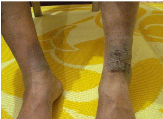
Fotografía tomada en 08/03/2012