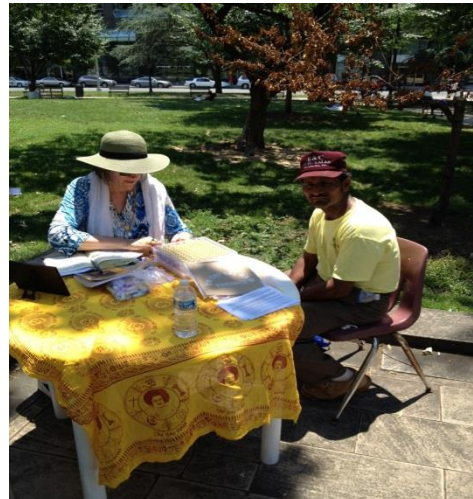
Vibriónica en el Parque – Sirviendo a los sin hogar Washington DC USA.