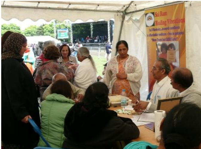
Puesto de Vibriónica en el Festival de la Unidad de las Religiones en el Southall Park, Londres

Practicantes: ¿Tienen alguna pregunta para el Dr. Aggarwal? Enviénsela a news@vibrionics.org