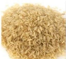
Parboiled brown rice