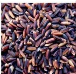
Black kavuni rice

3.1 Črni riž , ki ga pogosto imajo za prepovedanega, ima v resnici najvišjo hranilno vrednost. Zrnje je srednje velikosti, imeli so ga najprej na Kitajskem, je naravno brez glutena, bogato z beljakovinami, železom in