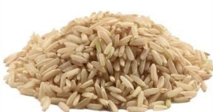
Long grain brown rice