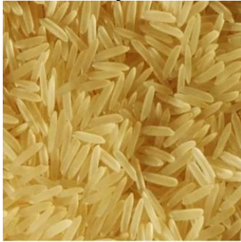
Long grain basmati

4.1 Arzenik je naravna sestavina okolja, ki je visoko toksičen v neorganski obliki in je znan po tem, da pospešuje raka. Arzenik je v zemlji in prsti posebno zaradi velike uporabe pesticidov in kurjega gnoja (poultry fertilizer), zato je v mnogih deželah z njim kontaminirano zrnje in hrana. Varno stopnjo arzenika v pitni vodi je določila organizacija WHO in je 10 µg/L. Vse rastline vsrkajo nekaj arzenika, riž pa več, ker raste v pogojih z več vode; rjavi riž ima 80% več arzenika kakor pa beli riž, ker se ga največ nabira v kožici; ekološko kmetovanje ne pomeni manj arzenika. Pravijo, da rjavi in beli riž basmati iz Kalifornije, Indije in Pakistana ter 'sushi' riž iz ZDA vsebujejo najmanj arzenika. Zelo poredko kje za vrste riža napišejo vsebino arzenika in kako z njim ravnamo. Za primerjavo imajo žitarice amarant, ajda in proso nepomembno količino arzenika. 2,20-22