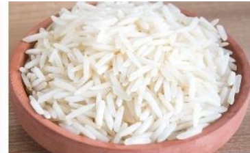
Long grain white rice