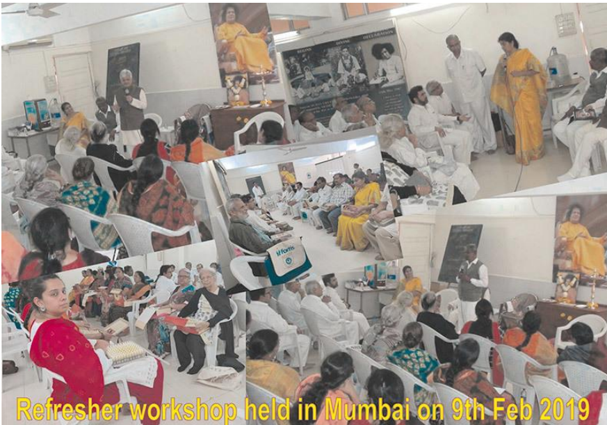
Refresher workshop held in Mumbai on 9th Feb 2019

Bogat in povezujoč osvežilni tečaj je obiskalo 36 zdravilcev in ga je vodila Starejša učiteljica