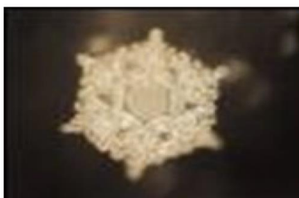
Love and Gratitude

S tem ko živimo v telesu smo na neki način premikajoče se vodne posode . Kakovost vode v nas je naravnost povezana s tem, kakšen tip človeškega bitja smo 13 ! To verjetno tudi nakazuje, da voda v našem telesu, možganih in srcu ni čista, dokler smo v mentalnem/čustvenem prijemu 6 sovražnikov : želje, jeze, ponosa, pohlepa, navezanosti in ljubosumnosti. Vodo v sebi in okoli nas lahko čistimo in polnimo s pozitivnostjo, ljubeznijo in hvaležnostjo. Na ta način je lahko vse prisotna voda v vseh oblikah medij za nas, da širimo mir, ljubezen in radost po vsem vesolju; to se nam povrne kot odsev, odziv in odmev.