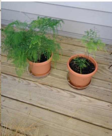
On right, October 2013