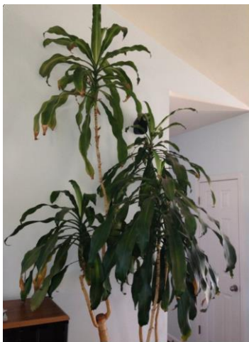
Corn plant, August 2013