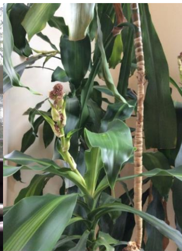
In bloom, October 2014