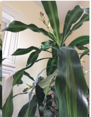
Second view, October 2014

Po dveh mesecih zdravljenja so oživele in dobro rase. Želim prikazati njihov napredek: Od takrat rastline redno dobivajo zdravilo 2TW . Velike rastline dobivajo 6-8 skodelic vode in manjše dve skodelici vode z zdravilom.