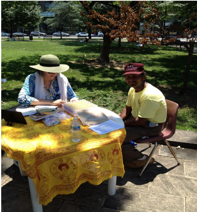
Vibro in Park - Serving the Homeless - Washington DC USA