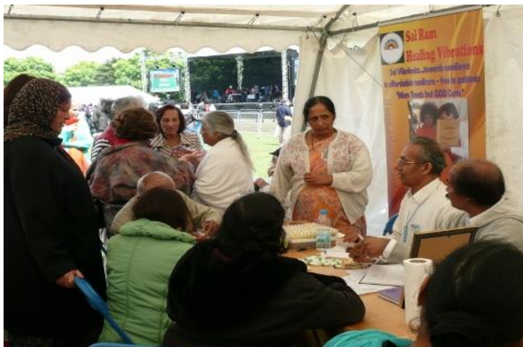
Vibrionics stall at the Unity of Faiths festival in Southall Park, London