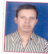
Bolnik 27 let