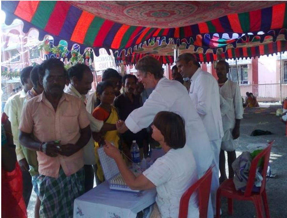
Выездная клиника 21-23 ноября 2012 на железнодорожной станции в Путтапартти