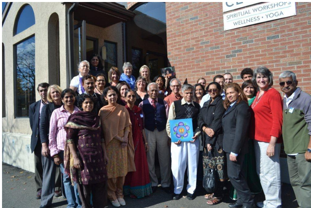
Участники семинара для начинающих практикующих. 20-21 октября 2012 в Хартфорде, США