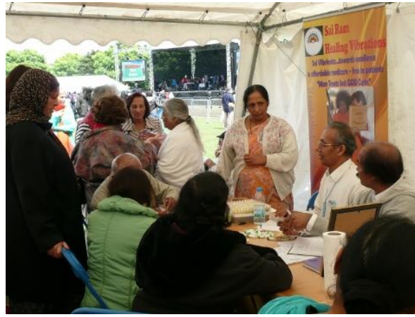
Павильон Вибрионикс на Фестивале Единства Вероисповеданий в парке Сауфхол в Лондоне