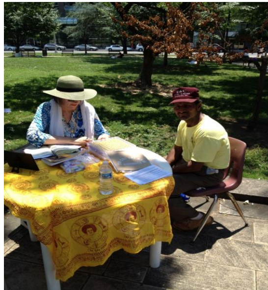
Вибрионикс в парке - помогая бездомным. Вашингтон, США