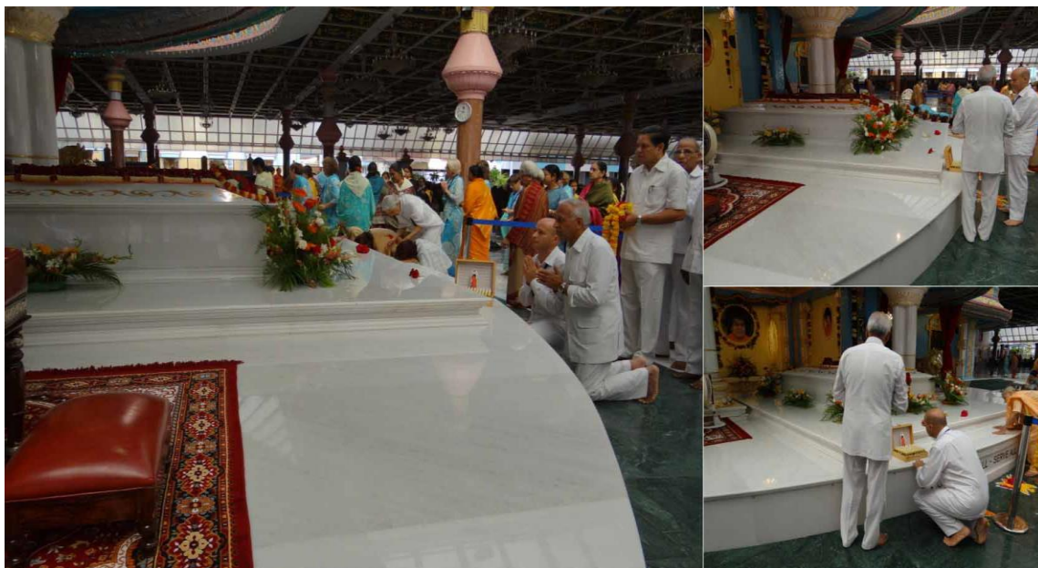
17 августа 2011: Первый экземпляр нового набора 108СС возложен к МахаСамадхи Бхагавана Саи Бабы.