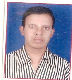
Возраст пациента - 27 лет