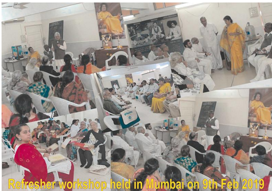
Refresher workshop held in Mumbai on 9th Feb 2019

Wysoce pouczający i interaktywny kurs odświeżający, w którym uczestniczyło 36 praktyków