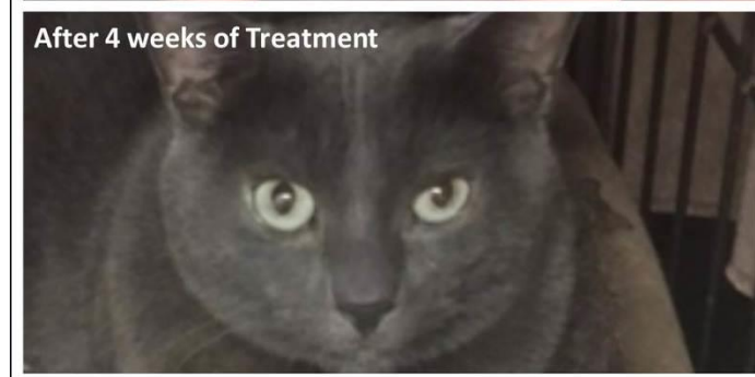
After 4 weeks of Treatment

wydobywała się wydzielina, a na prawym oku widoczne uszkodzenie (patrz zdjęcie). Dozorca powiedział, że kot wygląda na bardzo przygnębionego i siedział cicho zwinięty w kącie swojej skrzyni przez cały dzień i noc. Zabrali go do weterynarza, gdy tylko poczuli, że nie czuje się dobrze. Weterynarz zdiagnozował chorobę jako początek kociej opryszczki oczu. Krople do oczu były przepisane, ale nie przyniosły żadnej ulgi nawet po dwóch miesiącach. Schronisko nie miało pieniędzy w budżecie finansowym na dalsze wizyty lekarskie i zdecydowało się wypróbować wibronikę.