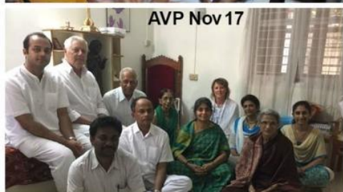
AVP Nov 17

Każdy nowy AVP dostaje osobistego mentora, pod którym ma on służyć, aż do awansu do pełnego VP. Podczas ostatnich czterech warsztatów wykonanych przez tych nauczycieli w latach 2017-18, przeszkolono 16 osób z Indii i 5 z Australii. Warsztaty SVP w Indiach są prowadzone tylko w Puttparthi raz w roku. W listopadzie 2017 r. szkolono siedmiu nowych SVP, oni w lutym 2018 r. przeszli zaawansowane szkolenie.