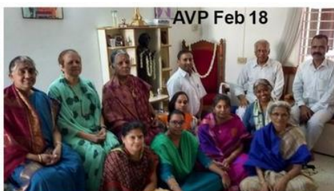
AVP Feb 18

Każdy nowy AVP dostaje osobistego mentora, pod którym ma on służyć, aż do awansu do pełnego VP. Podczas ostatnich czterech warsztatów wykonanych przez tych nauczycieli w latach 2017-18, przeszkolono 16 osób z Indii i 5 z Australii. Warsztaty SVP w Indiach są prowadzone tylko w Puttparthi raz w roku. W listopadzie 2017 r. szkolono siedmiu nowych SVP, oni w lutym 2018 r. przeszli zaawansowane szkolenie.