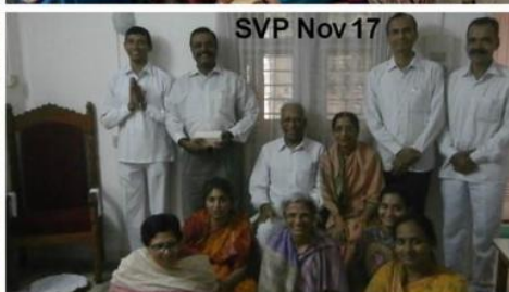
SVP Nov 17