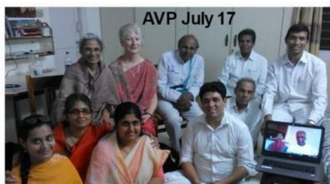
AVP July 17

Odtąd regularnie organizujemy praktyczne szkolenia AVP i SVP (każdy trwa 5 dni) w Puttparthi co najmniej 3 razy w roku podczas Shivaratri, Guru Purnima i urodzin Baby. Wszystkie warsztaty AVP są teraz prowadzone przez 2 doświadczonych certyfikowanych Nauczycieli 10375 & 11422 . Podczas tego intensywnego szkolenia przez pełne 5 dni, wszystkie AVP otrzymują praktyczne doświadczenie w leczeniu pod nadzorem, lecząc co najmniej 15 pacjentów.