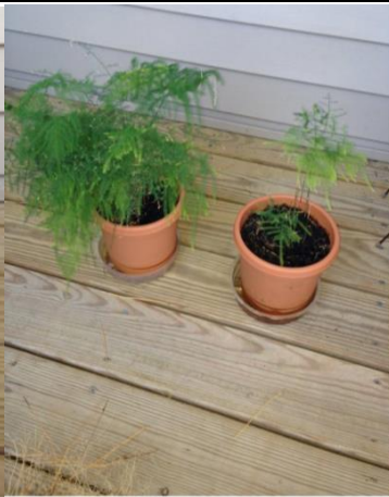
On right, October 2013