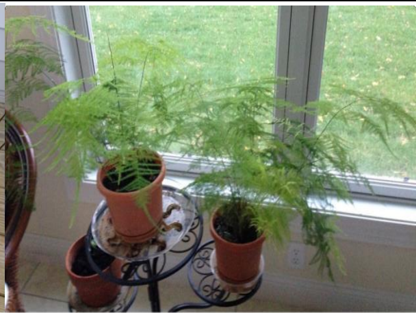
On right, October 2014