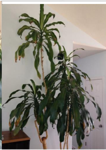
Corn plant, August 2013