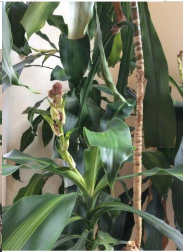
In bloom, October 2014