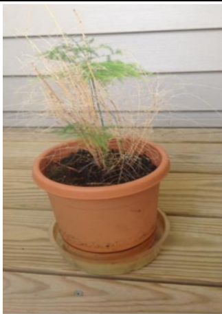
Fern, August 2013