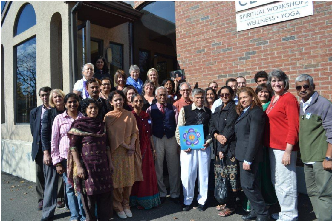
Warsztaty szkoleniowe dla młodszych użytkowników wibroniki 20-21 października 2012 r. w Hartford CT USA