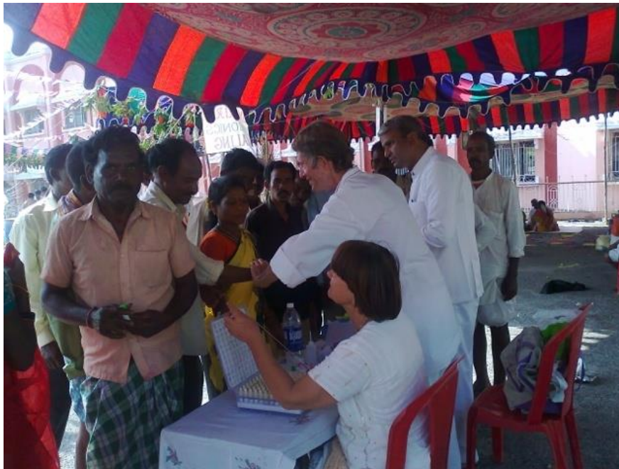
Obóz medyczny 21-23 listopada 2012 r. na stacji kolejowej Prasanthi Nilayam, Puttaparthi