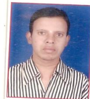
Dopo il Trattamento