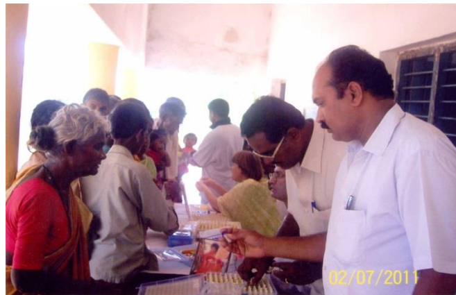
2 Settembre 2011: Campo Sanitario Vibrazionale tenuto vicino a Puttaparthi...300 pazienti trattati