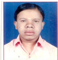
Prima del Trattamento