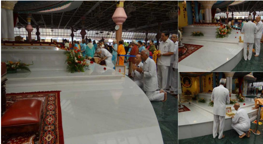
17 Agosto 2011: la scatola originale delle 108CC Vibrazionali offerta al Mahasamadhi di Baba