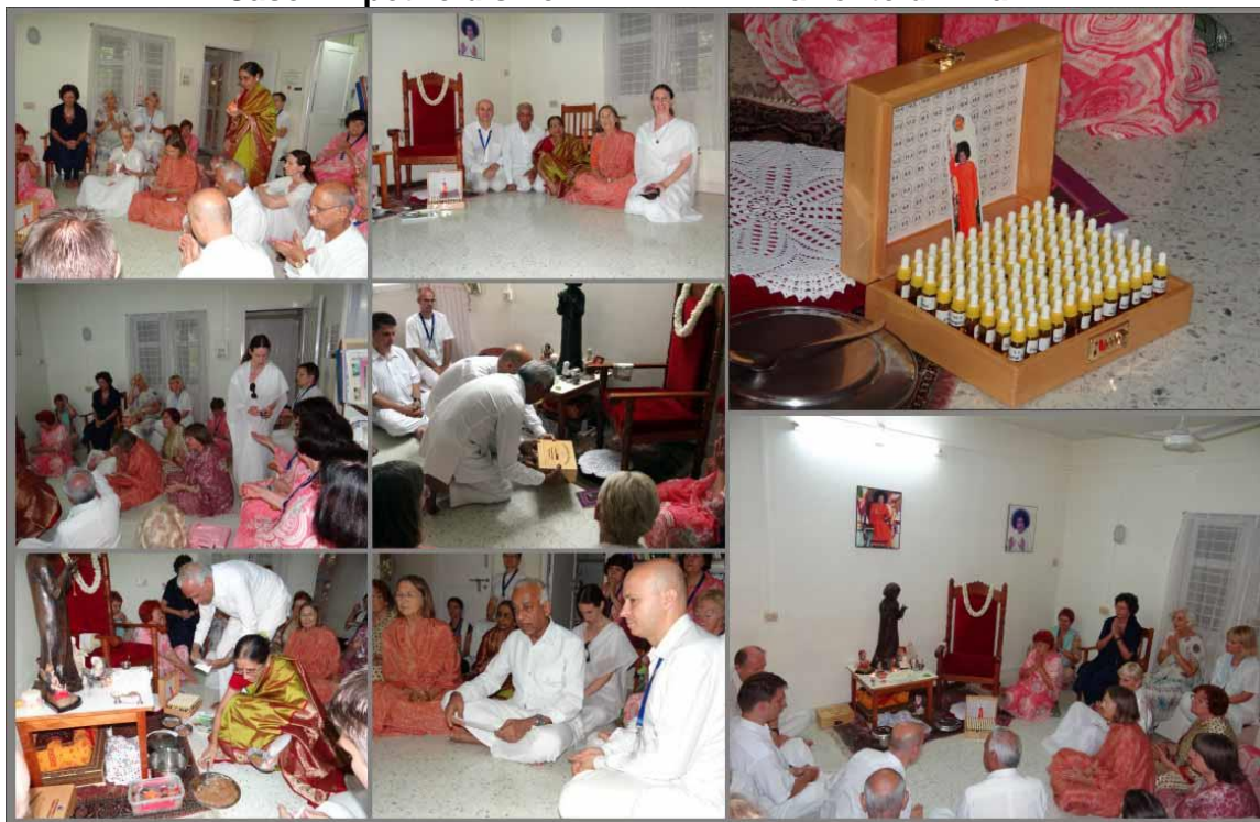
Paziente di 27 anni

16 Agosto 2011: I terapeuti offrono devotamente la scatola originale delle 108CC ai piedi di Loto di Swami.