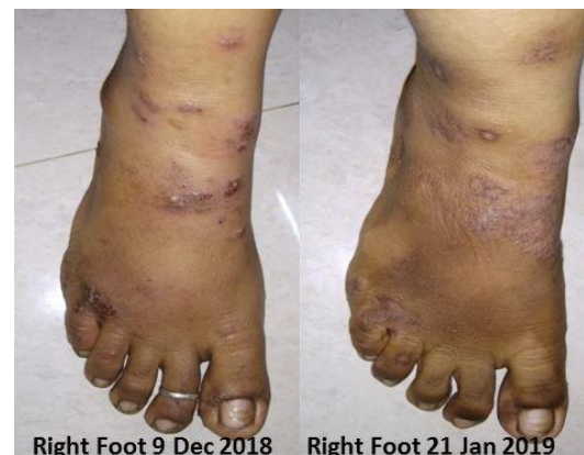
Right Foot 21 Jan 2019

#11. CC8.1 Τονωτικό για γυναίκες + CC9.2 Οξείες λοιμώξεις + CC12.1 Τονωτικό Ενηλίκων + CC15.1 Ψυχικό και συναισθηματικό τονωτικό + CC21.2 Δερματικές μολύνσεις + CC21.6 Έκζεμα ...μια δόση κάθε ώρα τη πρώτη μέρα