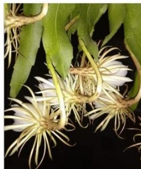
5 Sep 2021

Offensichtlich wuchs sie, aber nicht eine einzige Blüte war geblüht! Sie hatte die Vorteile von Vibrionics bei ihrer Verstopfung und während der Covid-19-Pandemie erfahren. Als sie erfuhr, dass Vibrionics auch Pflanzen helfen können, bat sie sofort um ein Mittel zur