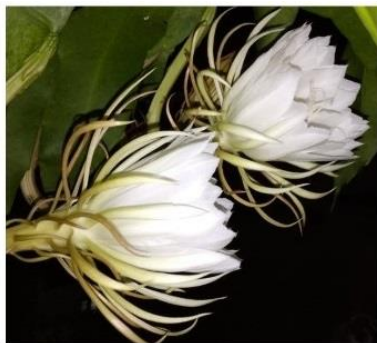
10 July 2021