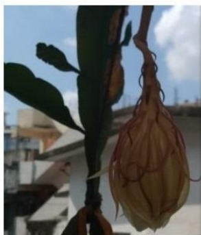
15 Sep 2020

Die ältere Schwägerin des Praktikers, eine große Pflanzenliebhaberin, hatte vor fünf Jahren eine Brahma kamalam* (Saussurea obvallata) gepflanzt.