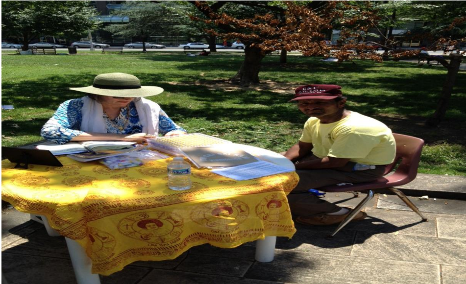
Vibro in Park – Dienst an die Obdachlosen Washington DC USA