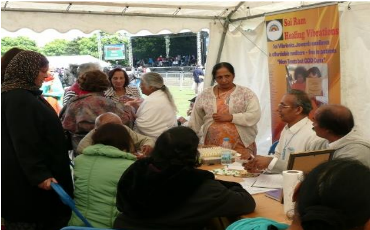
Vibrionics Stand beim Festival für die Einheit aller Glaubensrichtungen in Southall Park, London