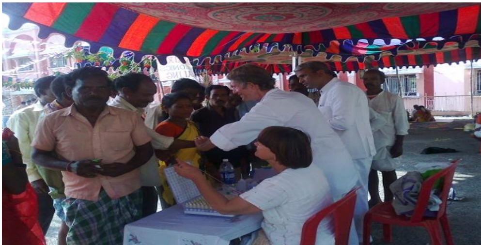
Medical Camp 21-23 November 2012 at PN Bahnsation, Puttaparthi