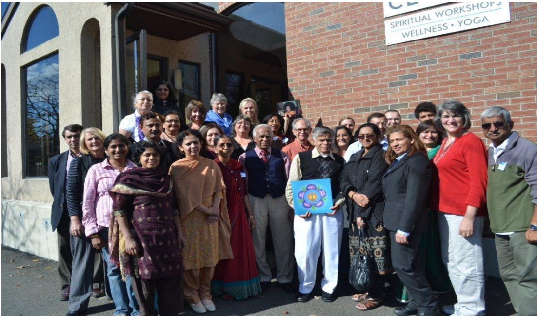
JVP Training Class 20-21 October 2012 in Hartford CT USA