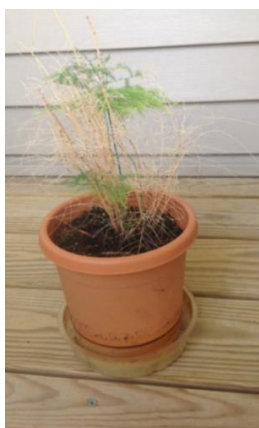
Fern, August 2013

CC1.2 Plant tonic + CC15.1 Mental & Emotional tonic...3TW dans l'eau.