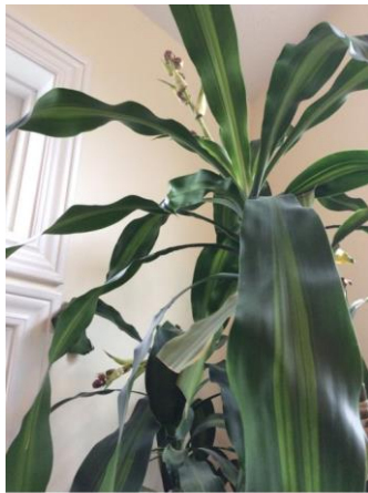
Second view, October 2014

Après deux mois de traitement, ils avaient bien récupéré et étaient florissantes. J'aimerais maintenant faire une mise à jour :