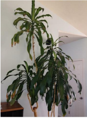
Corn plant, August 2013