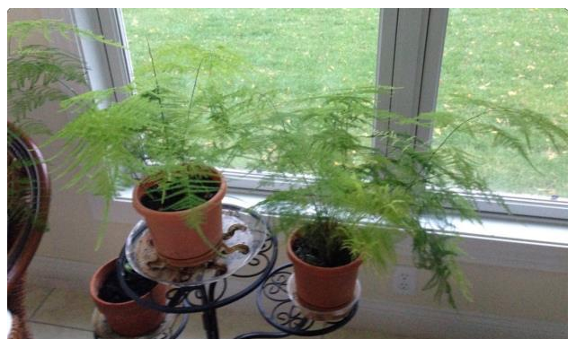
On right, October 2014