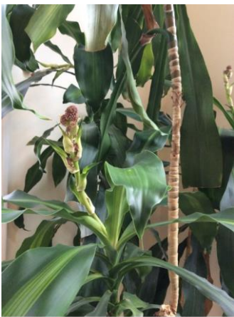
In bloom, October 2014