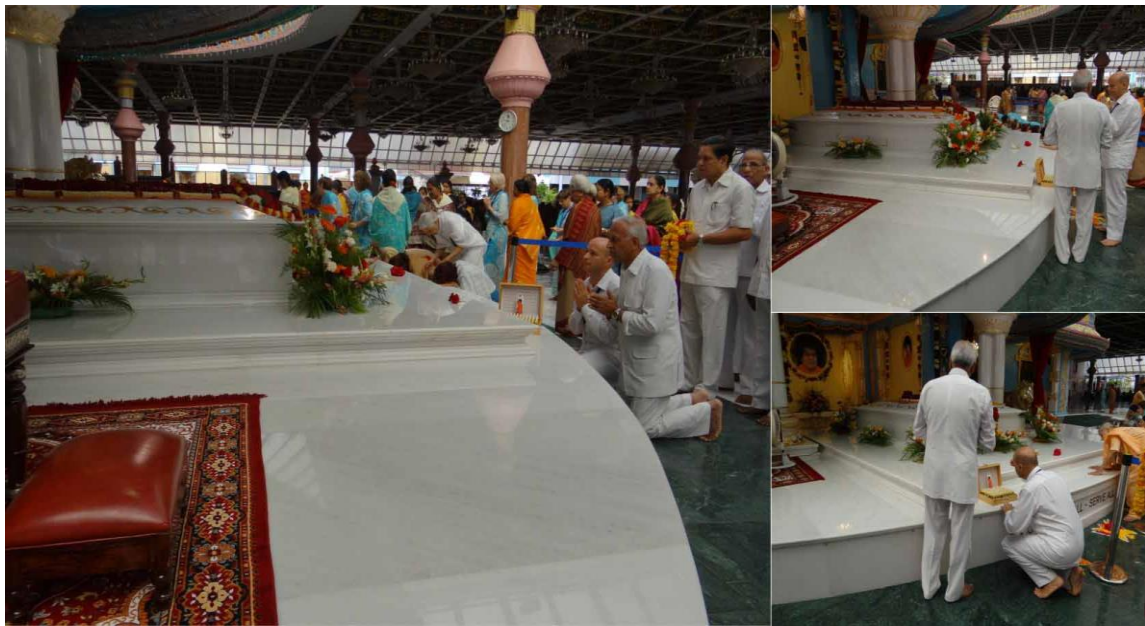
17 août 2011: la 108CC Master boîte Vibrionics offerte au Mahasamadhi de Bhagawan Baba