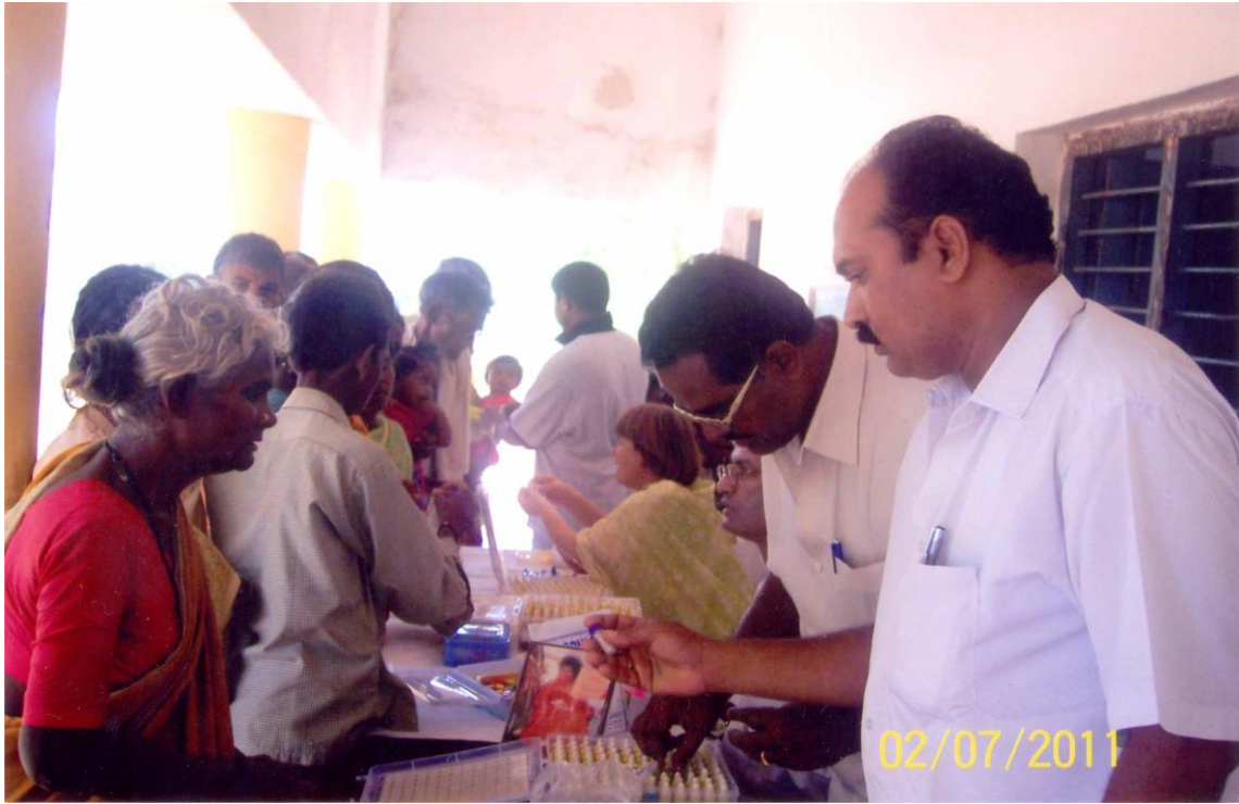
2 septembre 2011: Camp Vibrionics installé près de Puttaparthi...300 patients traités