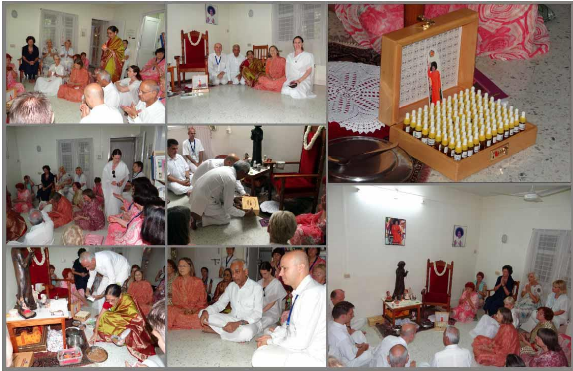
16 août 2011: Les praticiens en pleine prière offrant la 108CC Master boîte aux Pieds de Lotus de Swami