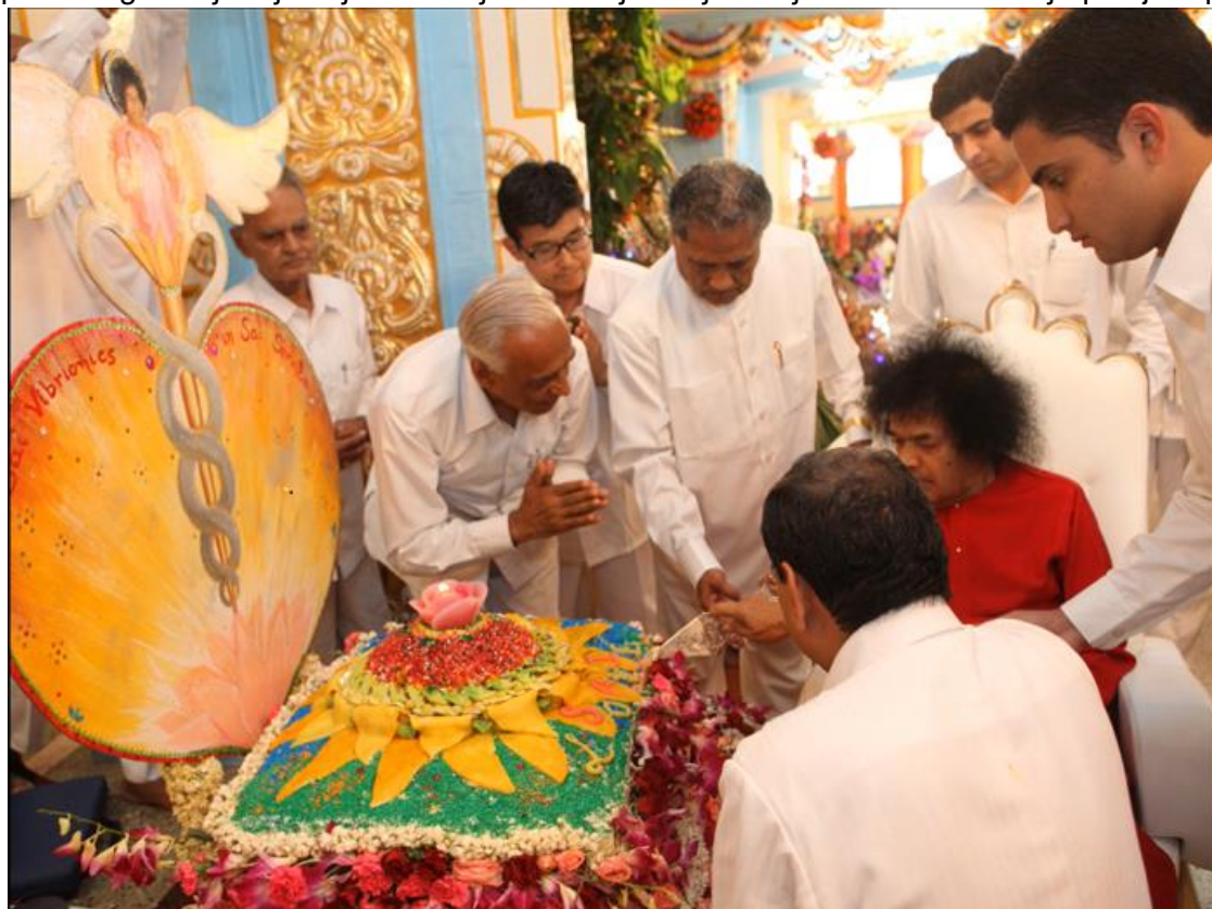
Guru Poornima 2010 - Swami cutting the cake

Imam privilegiju da vam se obratim u vrijeme Guru Purnime , dana posebnog za sve Sai poklonike. Ovaj dan u nama budi nostnjaalgična sjeća. Dok je Swami bio u fizičkom tijelu, na Guru Purnimu Mu bismo ponudili godišnji izvještaj i tortu koji bi On s ljubavlju zasijekao kako bismo je podijelili praktičarima kao