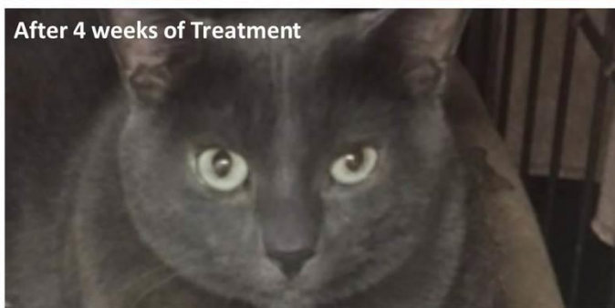
After 4 weeks of Treatment

a na desnom je imao leziju (vidi sliku). Čuvar je rekao da mačak izgleda vrlo potišteno i da po cijeli dan i noć sjedi sklupčan u uglu svog kaveza. Odveli su ga veterinaru čim su osjetili da nešto nije u redu. Veterinar je dijagnosticirao početak mačjeg herpesa očiju. Propisao mu je kapi za oči, ali mu one nisu pomogle čak ni nakon dva mjeseca. Sklonište nije imalo novca za daljnje posjete veterinaru, pa su odlučili da pokušaju s vibrionikom.