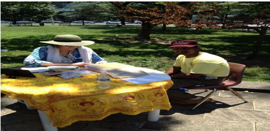
Vibro u Parku – Služenje beskućnika Washington DC, USA