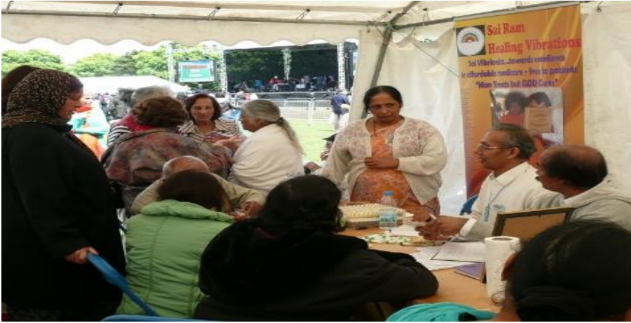
Vibriončki štand na Festivalu Jedinstva vjera u Southall Parku, London