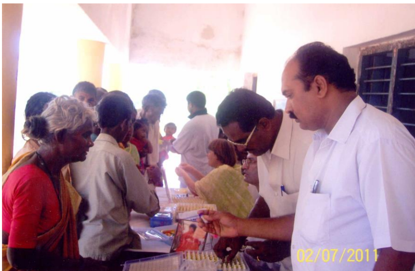
2 Rujan 2011: Vibrionički Kamp za ozdravljanje održan je u blizini Puttapparathi...300 pacijenata istretirano